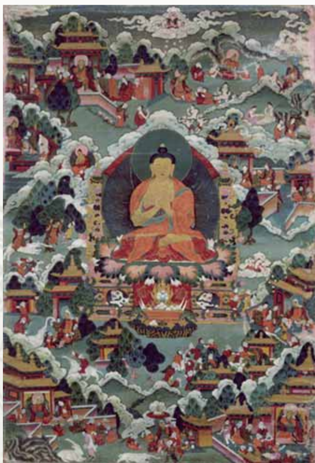
釋迦加持圖·十九世紀·西藏唐卡

仁人百萬。而能行一善則去一惡，去一惡則息一刑。一刑息於 rén rén bǎi wàn ér néng xíng yí shàn zé qù yí è qù yí è zé xī yí xíng yí xíng xī yú