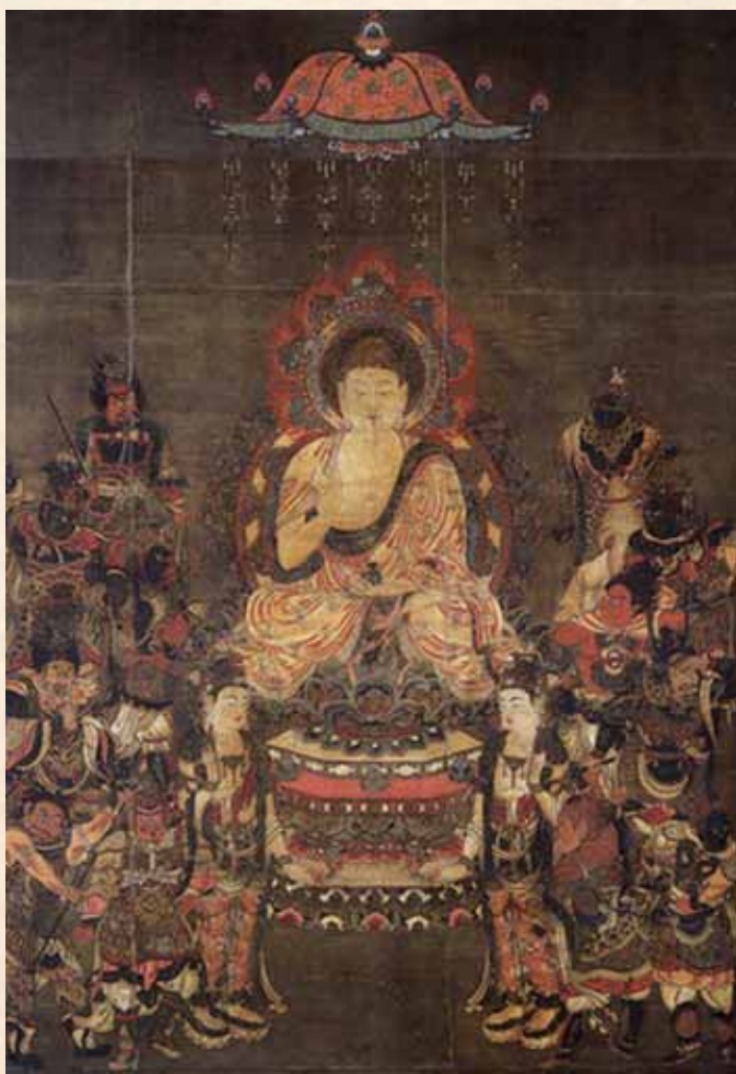
藥師三尊與十二神將・十三世紀