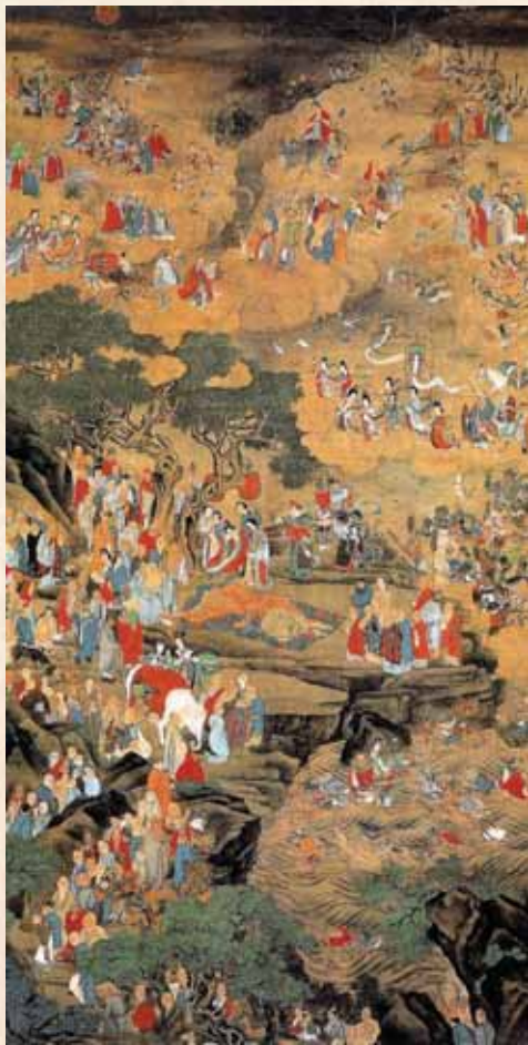
釋迦涅槃圖·明·吳彬

佛陀將要入涅槃的時候，曾再三囑咐諸比丘：「依四念處住，如佛無異。」如今正遭逢末法時期，很少見到有正念的學佛人。縱然遇到這個法門，又能有幾個肯去修學的呢？不但不去思悟其中的真義，而且連這最根本的名詞術語都搞不明白，實在是太可悲啦！我閑居無事，讀《涅槃經·遺教品》，取其中大義作成詩頌，借助音律，使詠唱者正念增長，妄心息滅。也可抄錄在案頭座邊，每天用來自警的同時，還能夠不忘佛陀的遺誡。