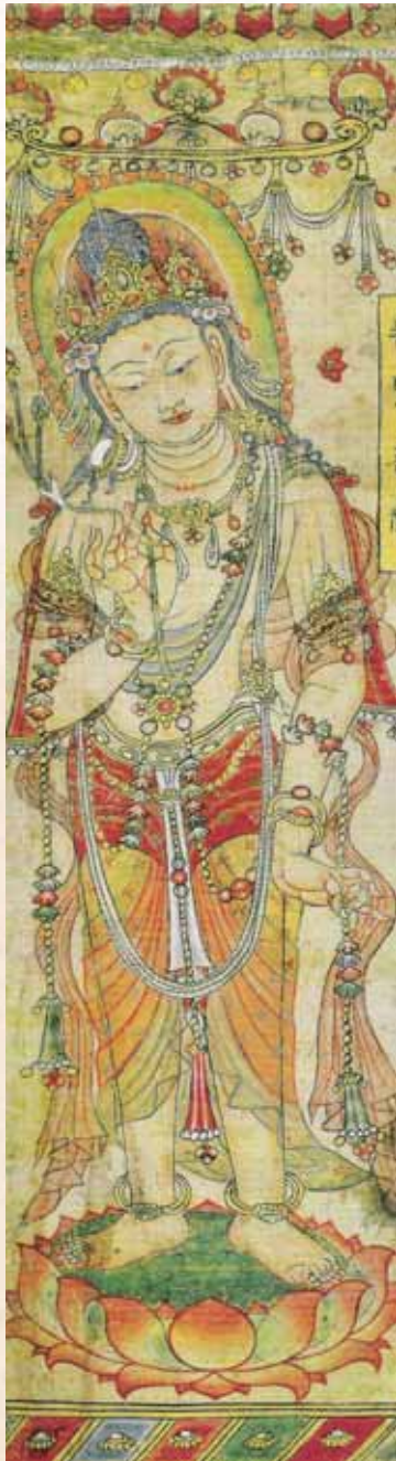
普賢菩薩像·唐·佚名

我 無 今 上 見 甚 聞 深 得 微 受 妙 持 法 ， 願 百 解 千 如 萬 來 劫 真 難 實 遭 義 遇 。