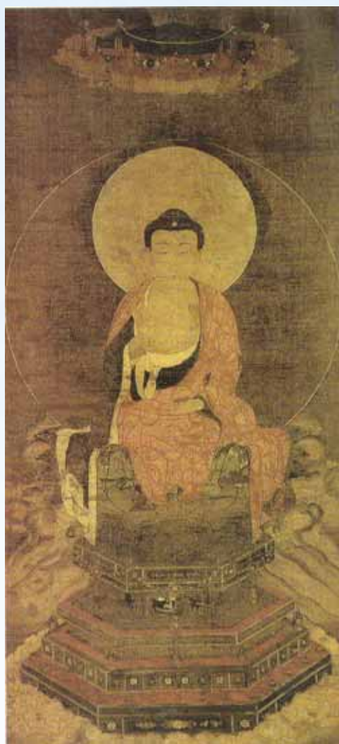
釋迦如來像·南宋·佚名