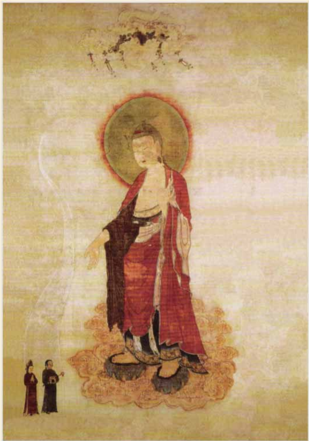
阿彌陀佛接引圖·西夏·佚名