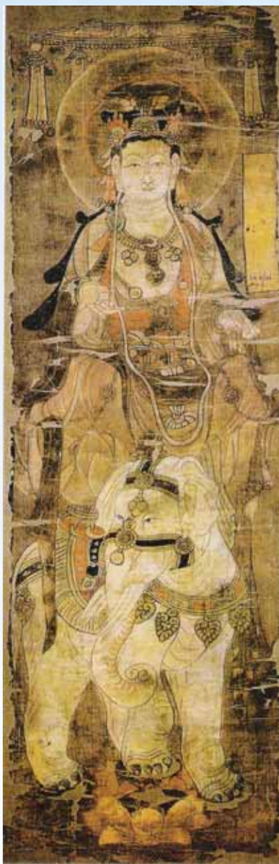
普賢菩薩立像·唐·佚名

我 無 今 上 見 甚 聞 深 得 微 受 妙 持 法 ， 願 百 解 千 如 萬 來 劫 真 難 實 遭 義 遇 。